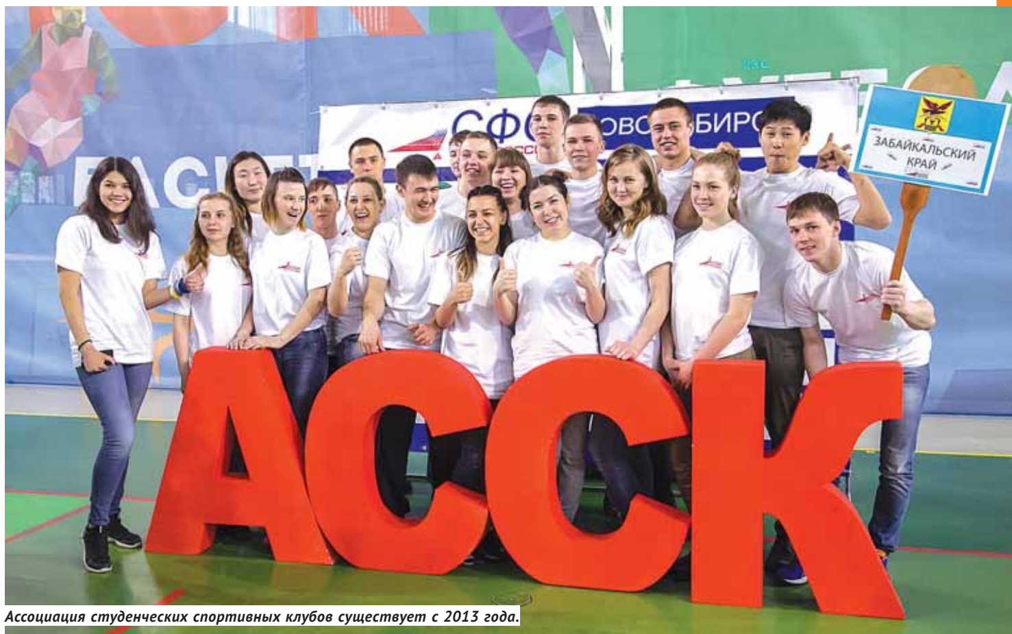
Ассоциация студенческих спортивных клубов существует с 2013 года.

Лучшие спортивные студенческие клубы Сибири встретились в Новосибирске.