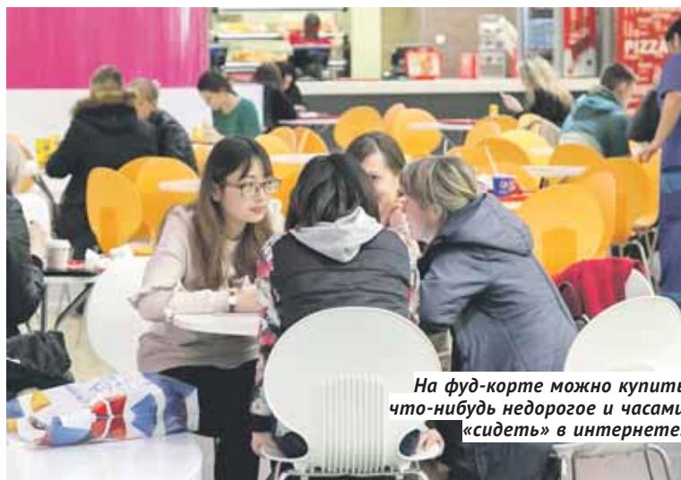
На фуд-корте можно купить что-нибудь недорогое и часами «сидеть» в интернете.

ТЦ, по мнению респондентов 12-15 лет, отличное место для времяпрепровождения. Здесь и в кино можно сходить на сэкономленные деньги, и с друзьями встретиться, и получить эмоции в какой-нибудь телесно-виртуальной игре — надеть специальные очки и переместиться в другую реальность. А если родители денег не дали — просто походить-поглазеть. Для многих подростков ТЦ — единственное место досуга, потому что спортом или творчеством они по разным причинам не занимаются. А ещё в ТЦ очень удобно прогуливать школу. Сел на диван и растворился в общей массе.