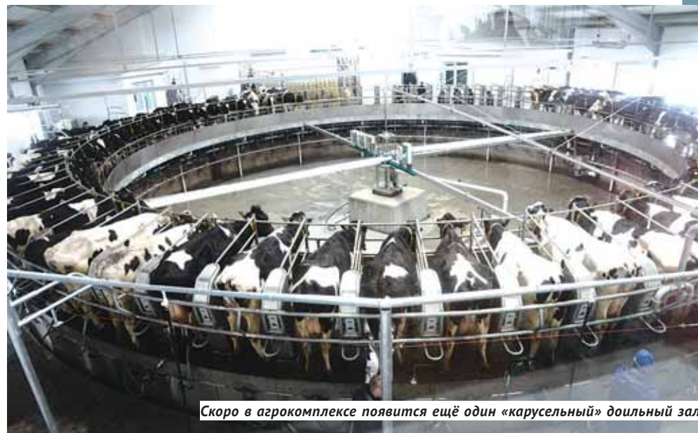
Скоро в агрокомплексе появится ещё один «карусельный» доильный зал.

Владимир Городецкий сообщил, что правительство рассматривает различные меры поддержки экономики района, включая газификацию территорий и обеспечение транспортной доступности производств. Кроме того, район имеет хороший