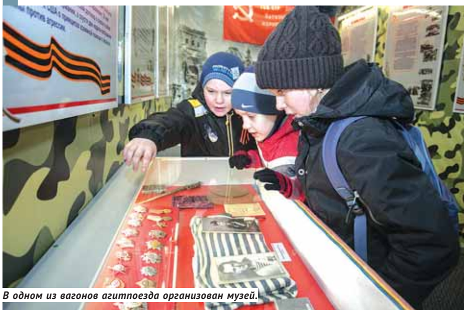
В одном из вагонов агитпоезда организован музей.

Они вышли из Иркутска и Пензы, чтобы пройти большую часть России и весь Центральный военный округ и завтра встретиться в его центре — на Урале, в Екатеринбурге. Агитационные поезда «Армия Победы» — информационно-пропагандистская акция, её второй год проводит Министерство обороны России при поддержке регионов, в которые прибывают уникальные поезда.