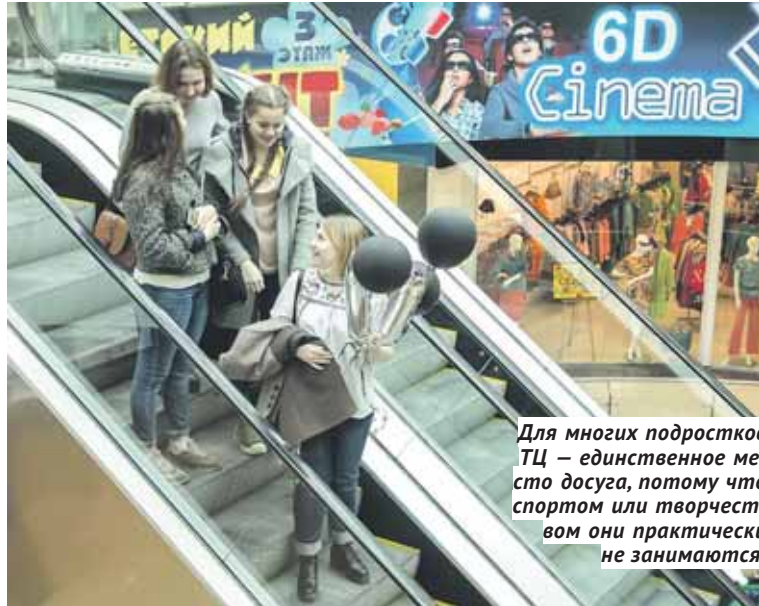
Для многих подростков ТЦ — единственное место досуга, потому что спортом или творчеством они практически не занимаются.